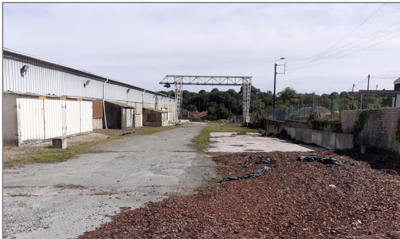
Photo n°2 : vue de la parcelle nouvellement rachetée sur laquelle les anciens locaux seront démolis